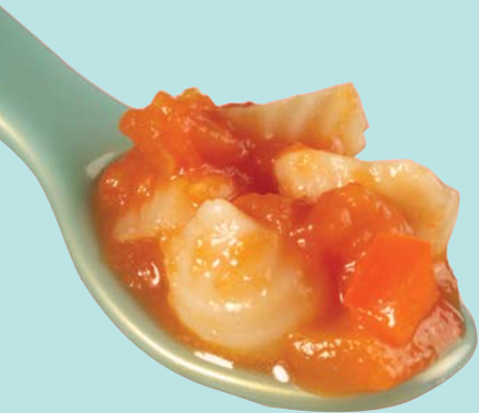
Простий томатно-овочевий соус

Коли ваша дитина підростає до першого дня народження, можна очікувати, що вона буде щодня їсти різні продукти з усіх харчових груп, таких як: