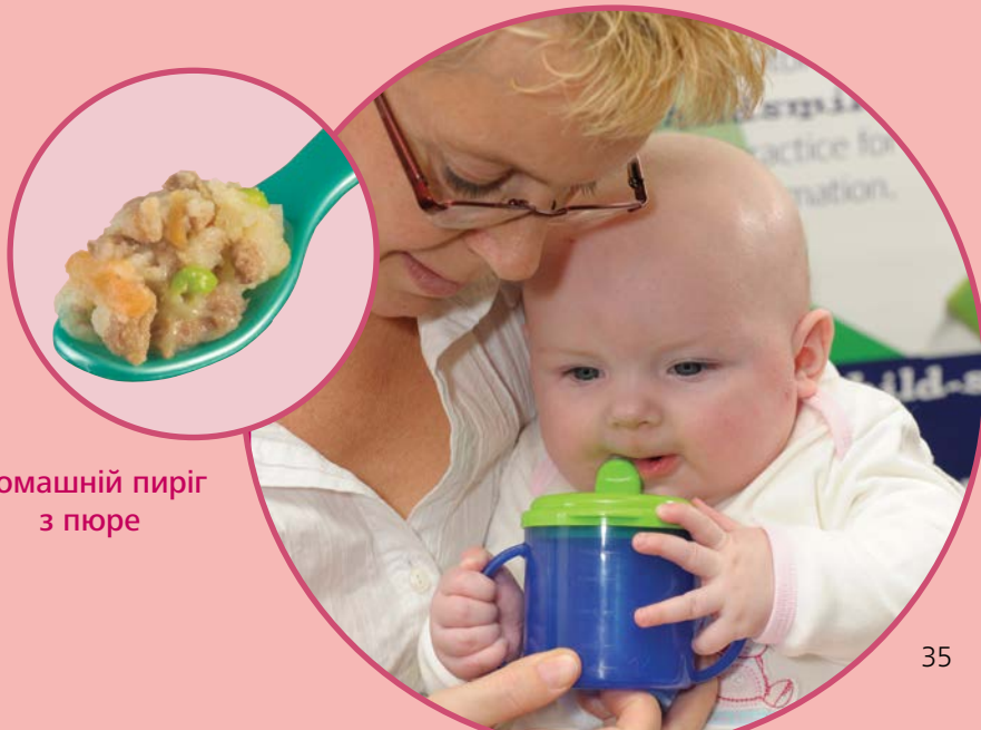
Домашній пиріг з пюре